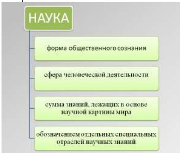
Рисунок 1 – Интерпретации термина «наука»

Непосредственные цели науки – описание, объяснение и предсказание процессов и явлений действительности на основе открываемых ею законов.