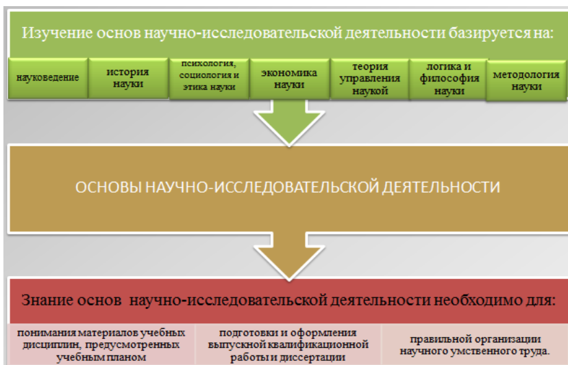
Рисунок 2 – Связь курса с другими дисциплинами